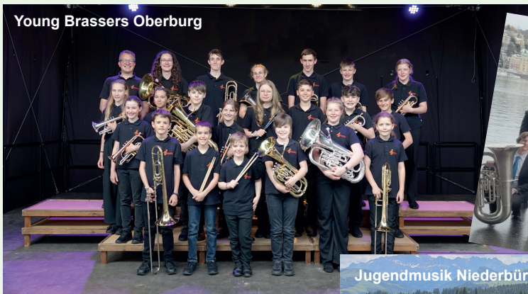
Young Brassers Oberburg