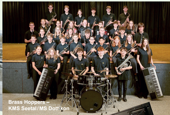
Brass Hoppers – KMS Seetal / MS Dottikon