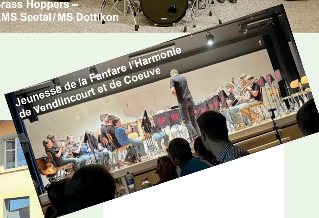
Jeunesse de la Fanfare l'Harmonie de Vendincourt et de Coeuve